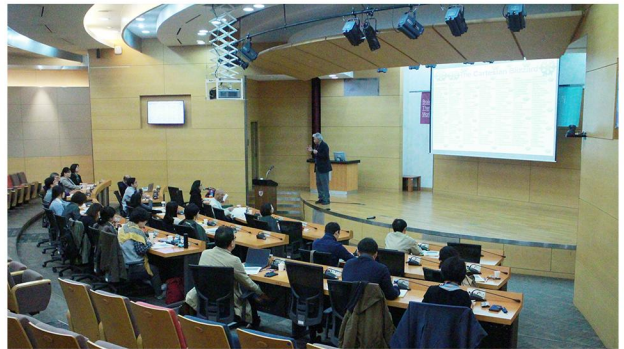
[지하 1층 국제원격회의실]