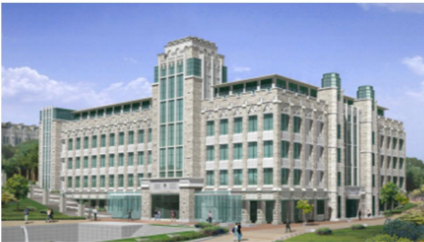
[고려대 100주년 기념관]

서울특별시 성북구 안암동 5가 1 고려대 100주년 기념관 국제원격회의실